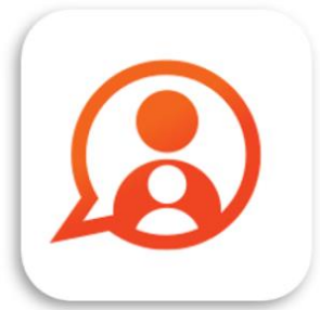
Konnect OuderApp Konnect B.V.

Gegevens niet ontvangen? Neem dan contact op met de kinderopvangorganisatie, zij kunnen nieuwe gegevens sturen.